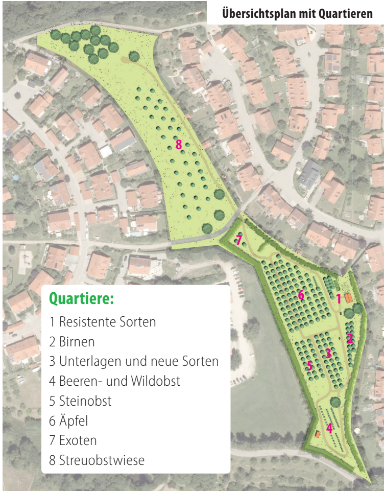
Übersichtsplan mit Quartieren

Mit einer Gesamtfläche von ca. 22.000 m 2 ist der Garten in verschiedene Quartiere eingeteilt. Besucher erwarten über 260 Gehölze mit weit mehr als 100 verschiedenen Obstsorten.